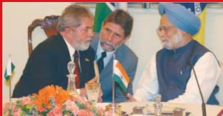
O Primeiro Ministro Manmohan Singh com o Presidente Lula, na cerimônia quando foram assinados sete acordos entre a Índia e Brasil, Nova Delhi.