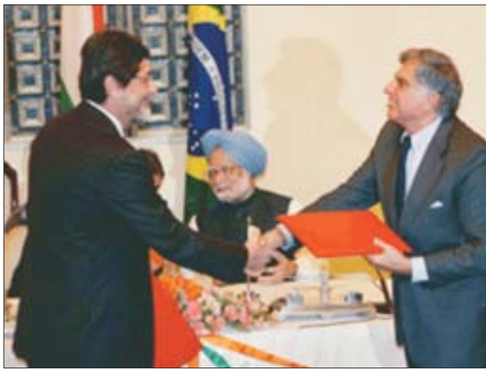
Ratan Tata, Presidente de Tata Sons e Sérgio Gabrielli, Presidente de Petrobrás após assinar o MoU no Fórum de Lideranças Empresariais.

O Presidente Lula afirmou que “o Fórum de Lideranças Empresariais estimulará o comércio bilateral e os investimentos. Para alcançar o objetivo, temos que diversificar nosso comércio atualmente restrito a produtos de menor valor agregado.”