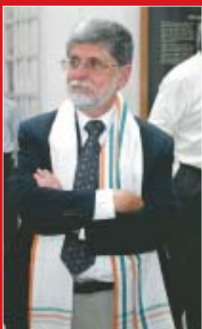
O Ministro Celso Amorim esperando o Presidente Lula durante a visita no Mahatma Gandhi Memorial Foundation em Tees January Marg em Nova Delhi, 5 de junho.