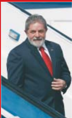
O Presidente Luiz Inácio Lula da Silva desce da aeronave na chegada à Base Aérea em Nova Delhi, 3 de junho.

Ao fortalecer nossos vínculos bilaterais em todas as esferas, Índia e Brasil estarão se habilitando a exercer, com crescente confiança e impacto, o papel de liderança e renovação que a comunidade internacional espera e que nossos cidadãos exigem.