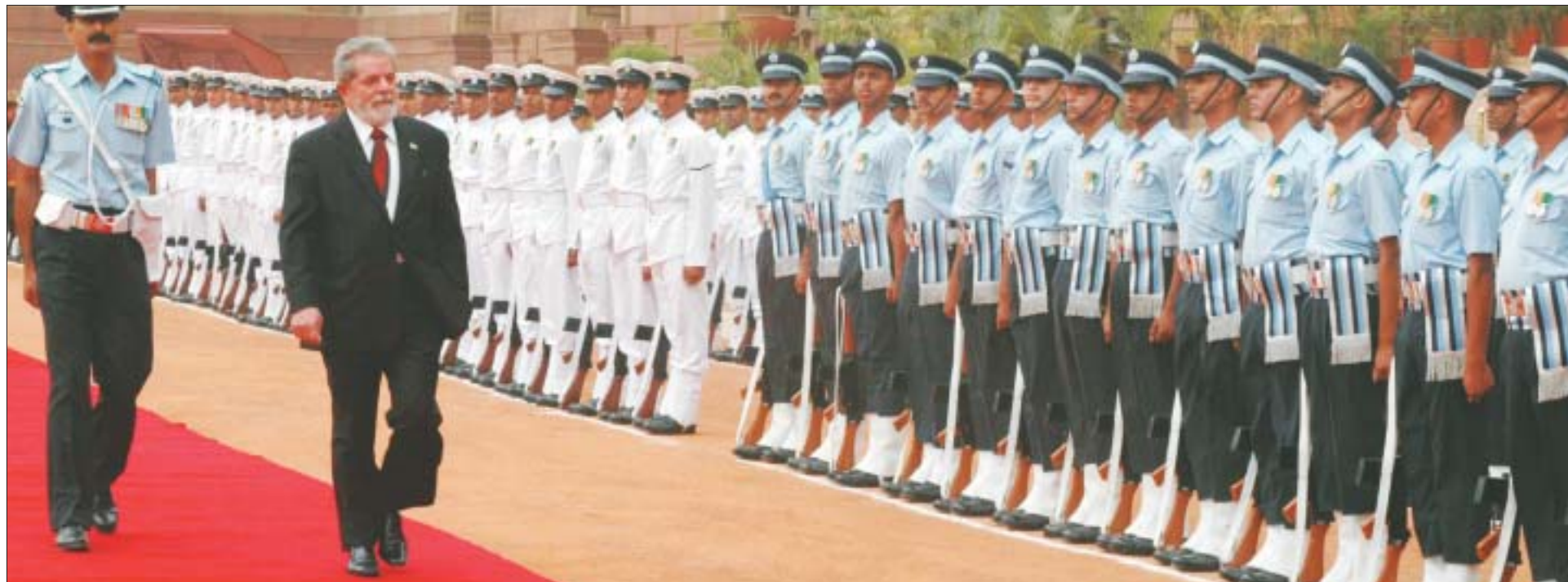
O Presidente Lula passa em revista a guarda de honra durante a cerimônia oficial de boas-vindas no Rashtrapati Bhavan, o Palácio Presidencial, em Nova Delhi no dia 4 de junho.

NÚMERO ESPECIAL SOBRE A VISITA DO PRESIDENTE LUIZ INÁCIO LULA DA SILVA À ÍNDIA (3-5 DE JUNHO DE 2007).