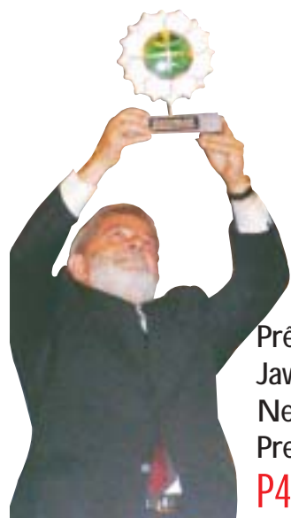
Prêmio Jawaharlal Nehru para Presidente Lula