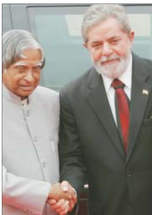
Presidente Kalam dando as boas vindas ao seu homólogo brasileiro no banquete

Referindo-se à cooperação no setor da aviação, disse: “Podemos cooperar no desenvolvimento de um jato de 100 passageiros, aproveitando as principais com-