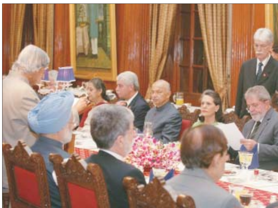
Presidente Kalam discursando no banquete O Presidente Lula, o Primeiro Ministro Manmohan Singh, a Presidente da UPA Sonia Gandhi, entre outros presentes.

“A Índia está atualmente comprometida no desenvolvimento de biodiesel e,