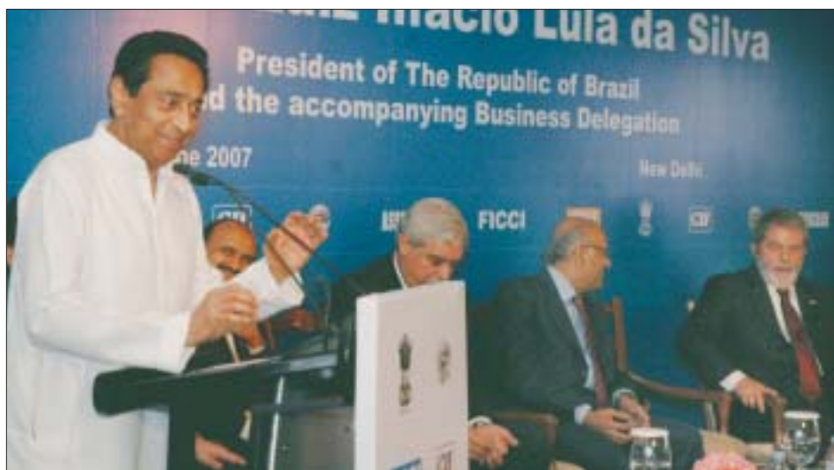
O Ministro do Comércio Kamal Nath discursando em uma reunião interativa organizada pelas principais instâncias empresariais e comerciais indianas, em Nova Delhi, no dia 4 de junho.

Kamal Nath disse que os investimentos indianos no Brasil também dispararam nos anos recentes, particularmente na informática, biotecnologia e farmacêutica, com a pre-