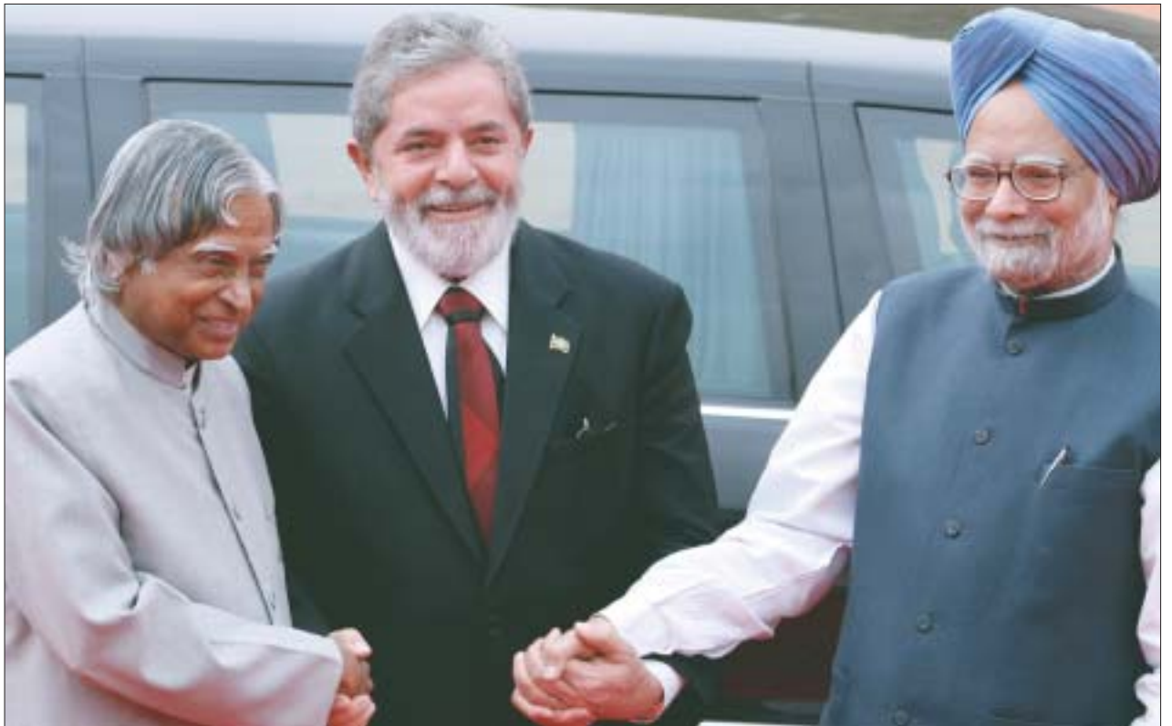
O Presidente A.P.J. Abdul Kalam e o Primeiro Ministro Manmohan Singh com o Presidente Luiz Inácio Lula da Silva durante a cerimônia de boas-vindas no pátio do Rashtrapati Bhavan, o palácio presidencial, em Nova Delhi, 4 de junho.

9. Identificou-se como área de particular interesse o desenvolvimento de programas de intercâmbio de brasileiros e indianos para melhor apreciação da cultura e das tradições dos dois países. Ambos os mandatários saudaram a decisão de sediar o Festival de Cultura Brasileira na Índia, de janeiro a março de 2008, e o Festival de Cultura Indiana no Brasil, de julho a setembro de 2008. Defenderam a promoção do intercâmbio de artistas, estudantes, jovens e turistas entre os dois países.