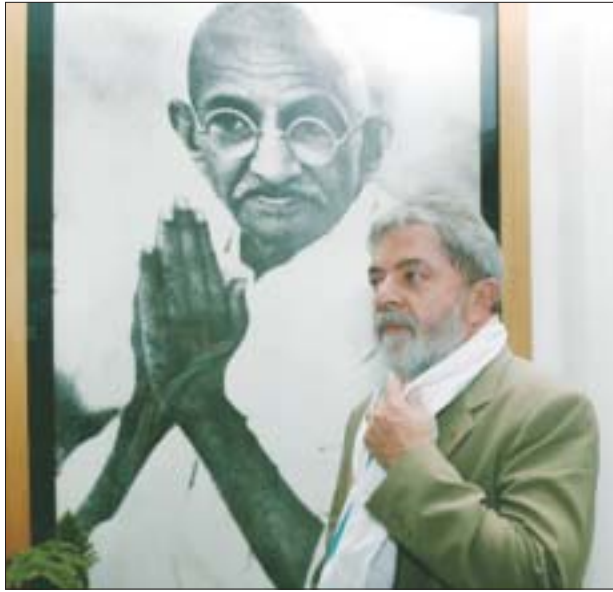
O Presidente Lula olhando uma obra de arte de Mahatma Gandhi durante a visita no memorial Mahatma Gandhi, o lugar onde Gandhi foi assassinado, no dia 5 de junho.

Este é o caso dos biocombustíveis. Aí estamos trabalhando para forjar uma verdadeira revolução energética.