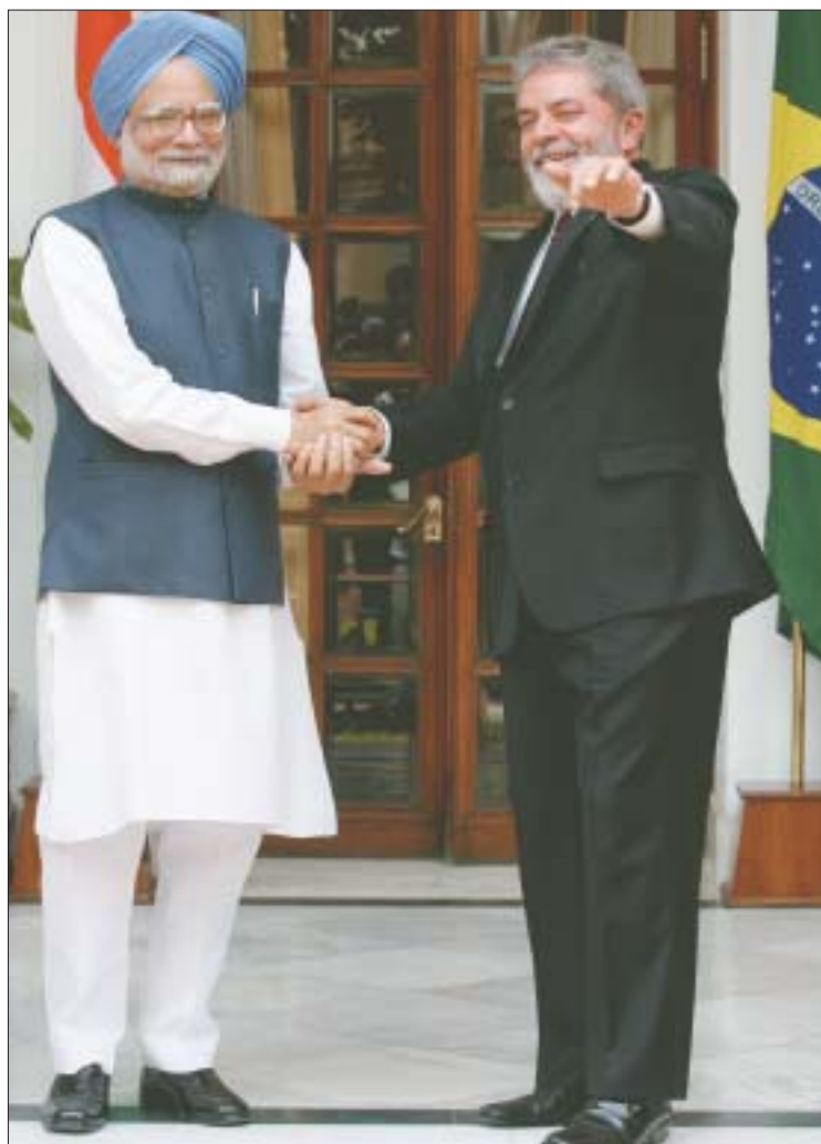
O Primeiro Ministro Manmohan Singh e o Presidente Luiz Inácio Lula da Silva durante as conversas bilaterais em Nova Delhi no dia 4 de junho.

co-presidentes do fórum, assinaram um memorando de entendimento (MoU) para estabelecer o Fórum de Lideranças Empresariais Brasil-Índia na presença de Manmohan Singh e Lula da Silva.