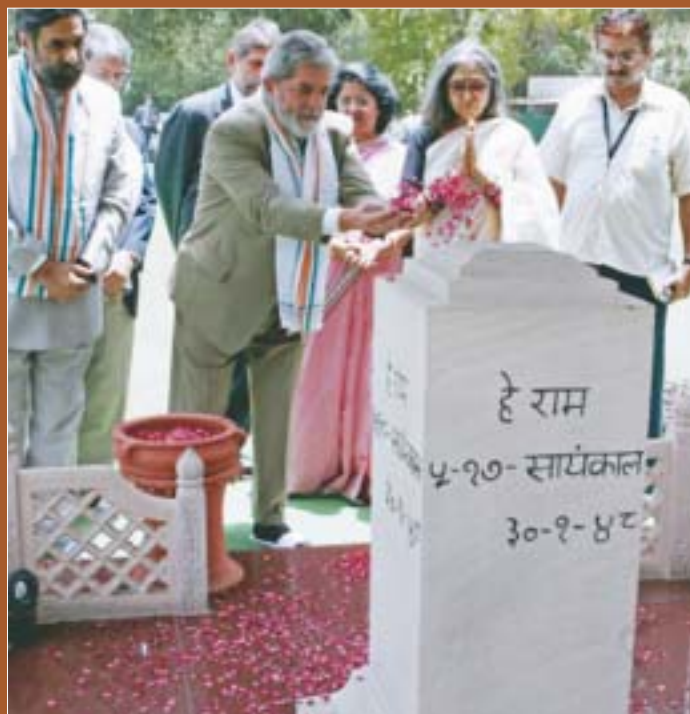
Presidente Lula prestando homenagem floral em Tees January Marg.