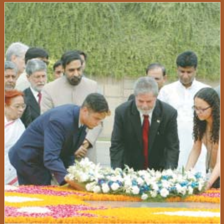
O Presidente Lula prestando homenagem floral em Rajghat.