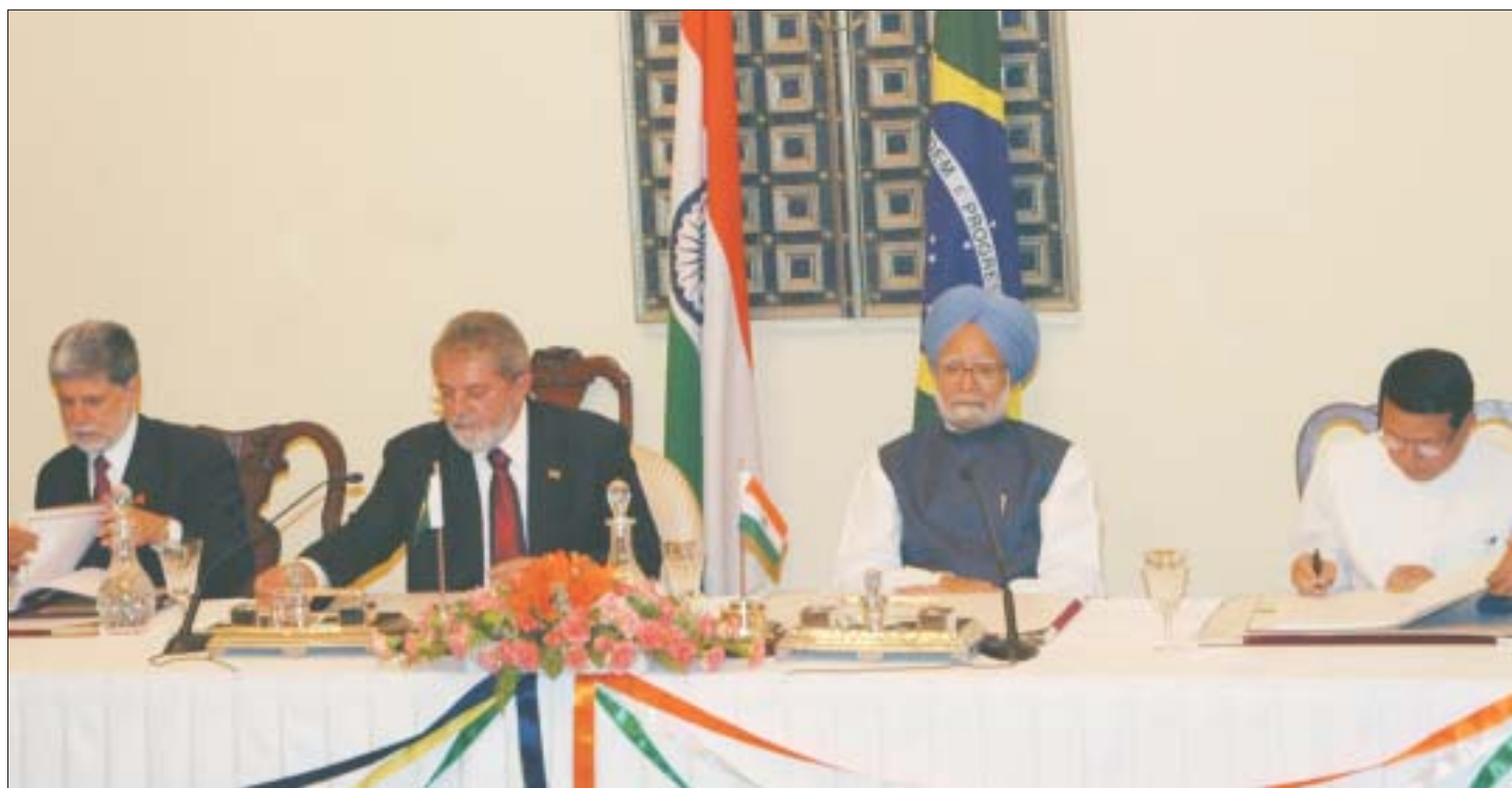
O Ministro para Informação & Difusão P.R. Dasmunsi, à direita, e o Ministro das Relações Exteriores Celso Amorim, à esquerda, assinando acordo de co-produção na presença do Primeiro Ministro Manmohan Singh e do Presidente Luiz Inácio Lula da Silva, em Nova Delhi.

A oportunidade para as localidades indianas de serem utilizadas durante as filmagens aumentará a visibilidade da Índia, tanto no Brasil quanto no mundo, e