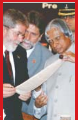
O Presidente Lula lendo o rolo do prestigioso Prêmio Jawaharlal Nehru para a Compreensão Internacional 2006, depois de recebê-lo do Presidente A.P.J. Abdul Kalam. (Direita), no dia 4 de junho.