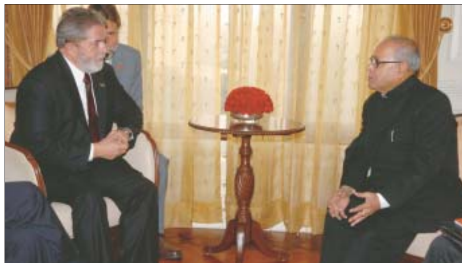
Durante a visita à Índia, o Presidente Lula encontrou Sonia Gandhi (acima à esquerda), Presidente da Aliança Progressiva Unida (UPA), Pranab Mukherjee (acima), Ministro das Relações Exteriores, Murli Deora (abaixo à esquerda), Ministro do Petróleo e Gás Natural.