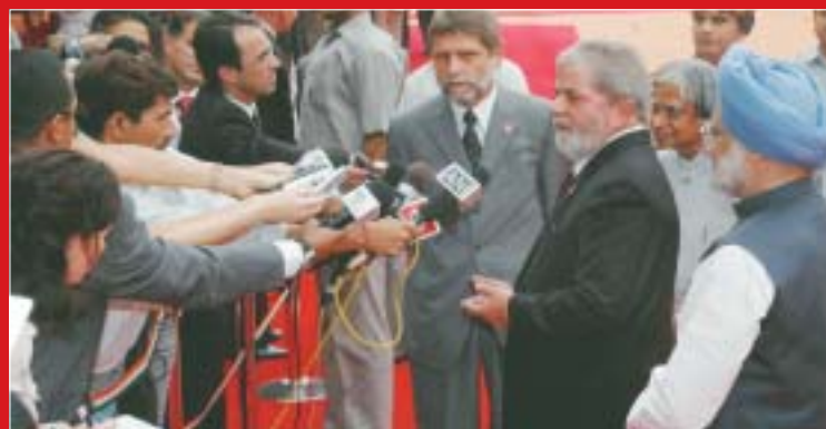
O Presidente Lula da Silva interagindo com a mídia, após a recepção cerimonial no Rashtrapati Bhavan, Nova Delhi, 4 de junho.