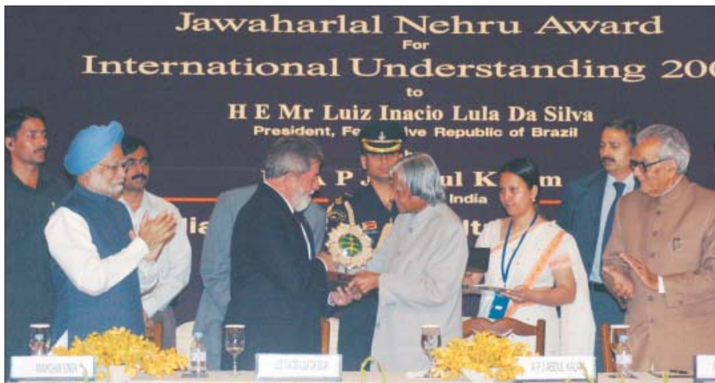
Presidente Kalam oferecendo o Prêmio Jawaharlal Nehru da Compreensão Internacional 2006 ao Presidente Lula em Nova Delhi, 4 de junho. O Vice-Presidente Bhairon Singh Shekhawat (extrema direita) e o Primeiro Ministro Manmohan Singh (segundo à esquerda), também na fotografia.

Ao oferecer o prêmio no Hotel Taj Mahal, Kalam disse que a Índia avaliou a contribuição de Lula no adiantamento da relação entre os dois países e foi “um privilégio honrá-lo hoje como um verdadeiro amigo da Índia, um excelente líder para o Brasil, que simboliza as aspi-