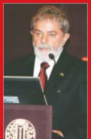
Presidente Lula discursando após receber o Prêmio Jawaharlal Nehru da Compreensão Internacional em Nova Delhi, no dia 4 de junho

Declaração de Exoneração de Responsabilidade: Notícias da Índia reúne conteúdos de fontes diversas e as visões expressas em entrevistas e artigos publicados não representam necessariamente as visões da Embaixada ou do Governo da Índia.