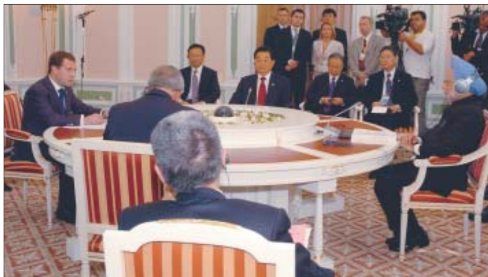
O Primeiro Ministro Dr. Manmohan Singh discursando na Cúpula do BRIC em Ecatimburgo, Rússia, 16 de junho.

Houve um consenso de que o protecionismo ou as restrições à livre circulação