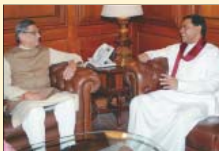
Basil Rajapakse, irmão e assessor do Presidente do Sri Lanka, Mahinda Rajapakse, com o Ministro das Relações Exteriores, S.M. Krishna, em Nova Delhi, 24 de junho.