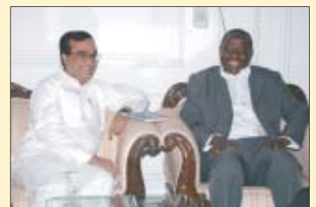
O Ministro ugandense dos Assuntos Internos, Matia Kasaija, com o Ministro do Interior, Ajay Maken, em Nova Delhi, 25 de junho.