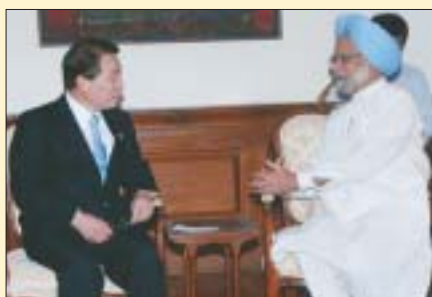
O Ministro das Relações Exteriores e Comércio da Coreia do Sul, Yu Myung-hwan, recebido pelo Primeiro Ministro, Dr. Manmohan Singh em Nova Delhi, 23 de junho.