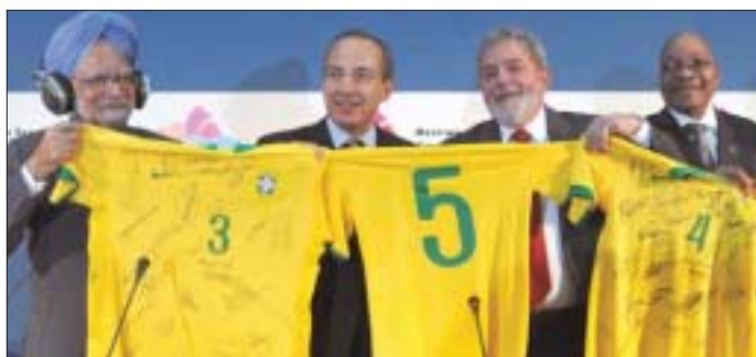
O Primeiro Ministro Dr. Manmohan Singh, com os líderes do G5, segurando a camiseta autografada pela Seleção Nacional do Brasil oferta pelo Presidente Lula na Conferência Coletiva do Comunicado Conjunto, em L'Aquila, 8 de julho

■ Comprometemo-nos a levar adiante o processo de reforma das organizações internacionais, inclusive a ONU, para refletir a realidade e os desafios contemporâneos e realçar sua relevância, legitimidade e eficiência.