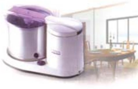
Elgi Equipments abre subsidiária integral no Brasil P4