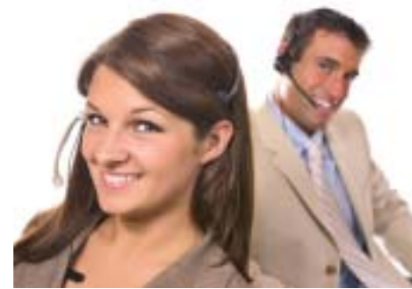
Índia ainda é o melhor hub de outsourcing P5