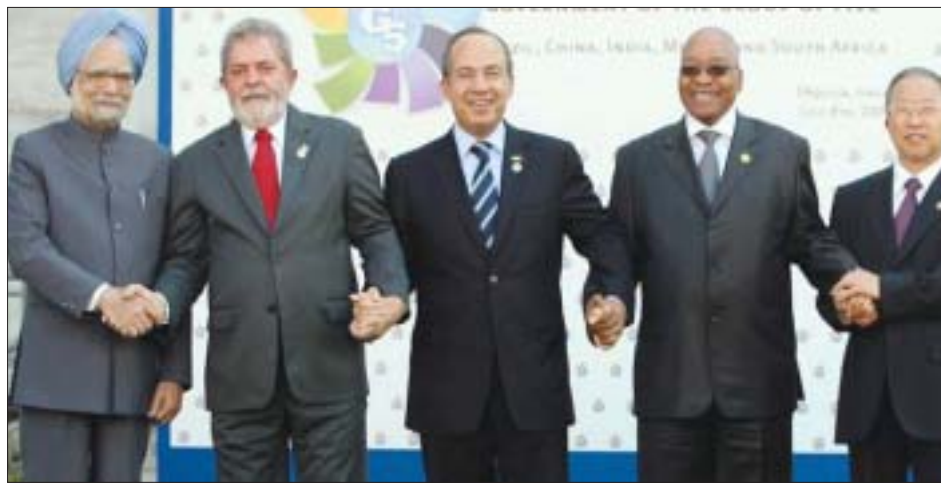
À esquerda: PM Dr. Manmohan Singh, Presidente do Brasil Lula da Silva, Presidente do México, Felipe Calderón, Presidente da África do Sul, Jacob Zuma, e Vice-Ministro dos Negócios Estrangeiros chinês, Dai Bingjao, em L'Aquila, Itália, 8 de julho

■ Também acreditamos que um reforçado sistema multilateral de comércio tem um papel a desempenhar na promoção do desenvolvimento e redução da pobreza. A plena integração dos países em desenvolvimento no comércio mundial requer um sistema multilateral de comércio justo, equitativo e favorável ao desenvolvimento. A Rodada de Desenvolvimento de Doha deve proporcionar um melhor e real acesso ao mercado para os produtos e serviços dos países em desenvolvimento e também assegurar resultados significativos onde residem as maiores distorções, eliminando os subsídios à exportação e reduzindo as enormes distorções comerciais dos subsídios nos países desenvolvidos. O objetivo deve ser o de assegurar que o sistema de