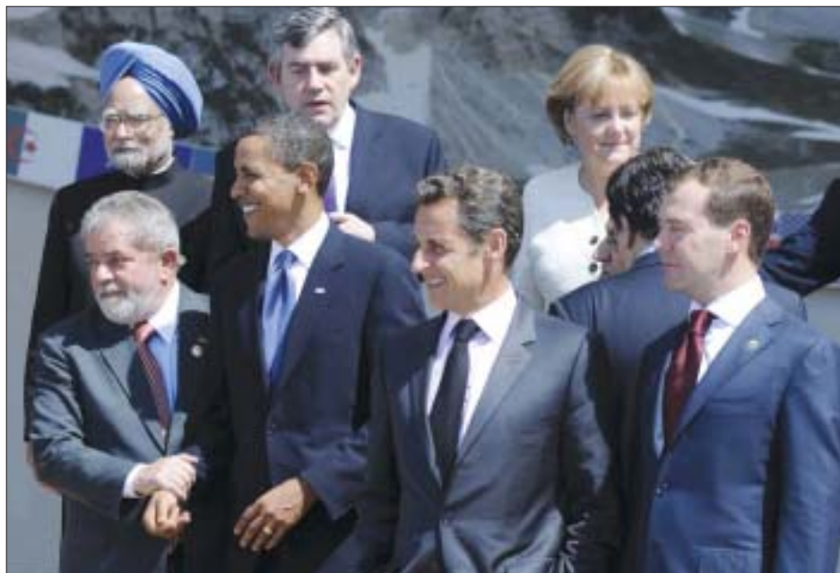
O Primeiro Ministro Manmohan Singh com os líderes dos países do G8 e G5 em L'Aquila, Itália, 9 de julho. O Presidente Lula da Silva também estava presente

■ Nós, líderes da Itália, Brasil, Canadá, República Popular da China, França, Alemanha, Índia, Japão, México, Rússia, África do Sul, Reino Unido, Estados Unidos da América, o Presidente da Comissão Européia, juntamente com os líderes do Egito, da Suécia e o Presidente do Conselho Europeu, comprometemo-nos a trabalhar juntos para lidar com os desafios globais e aprimorar a governança internacional. Nosso propósito é estimular uma parceria autêntica no contexto de um multi-