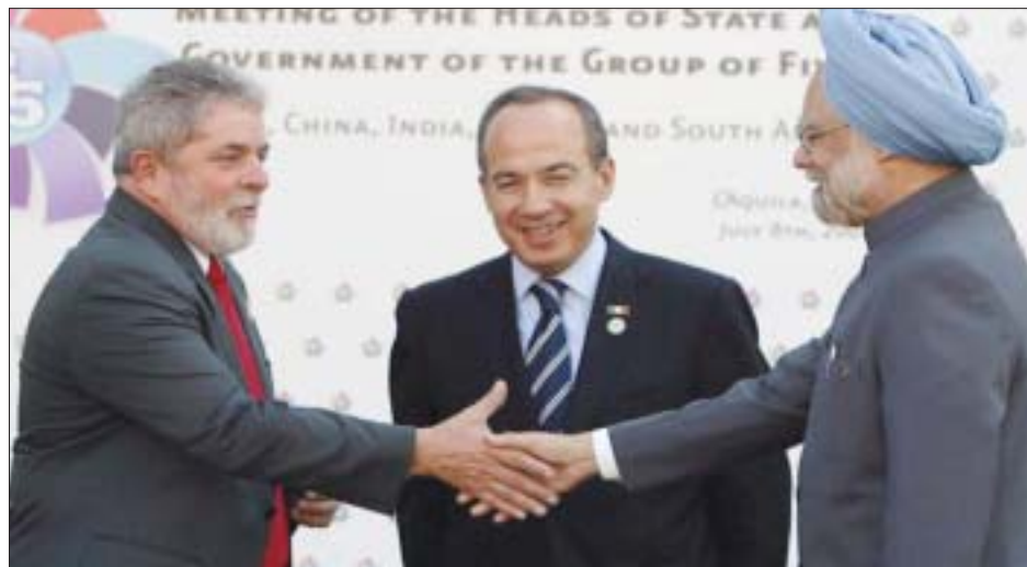
O Primeiro Ministro Dr. Manmohan Singh cumprimentando o Presidente Lula da Silva durante a Cúpula do G5, em L'Aquila, Itália, no dia 8 de julho, na presença do Presidente do México, Felipe Calderón

Os países em desenvolvimento são também os mais afetados pelos preços elevados dos alimentos. Concordamos que a agricultura e a segurança alimentar devem ser colocadas no cerne da agenda internacional com atenção especial para os interesses dos pequenos agricultores à margem da sociedade. Como membros responsáveis da