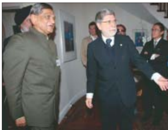
O Chanceler S.M. Krishna saudando Celso Amorim em Nova Iorque

sobre a Cúpula do G-20, o Processo de Heiligendamm-L'Aquila (HAP), os compromissos do Grupo Ampliado na Cúpula de 2010 em Muskoka e a coordenação entre os países do G-5 sobre questões de