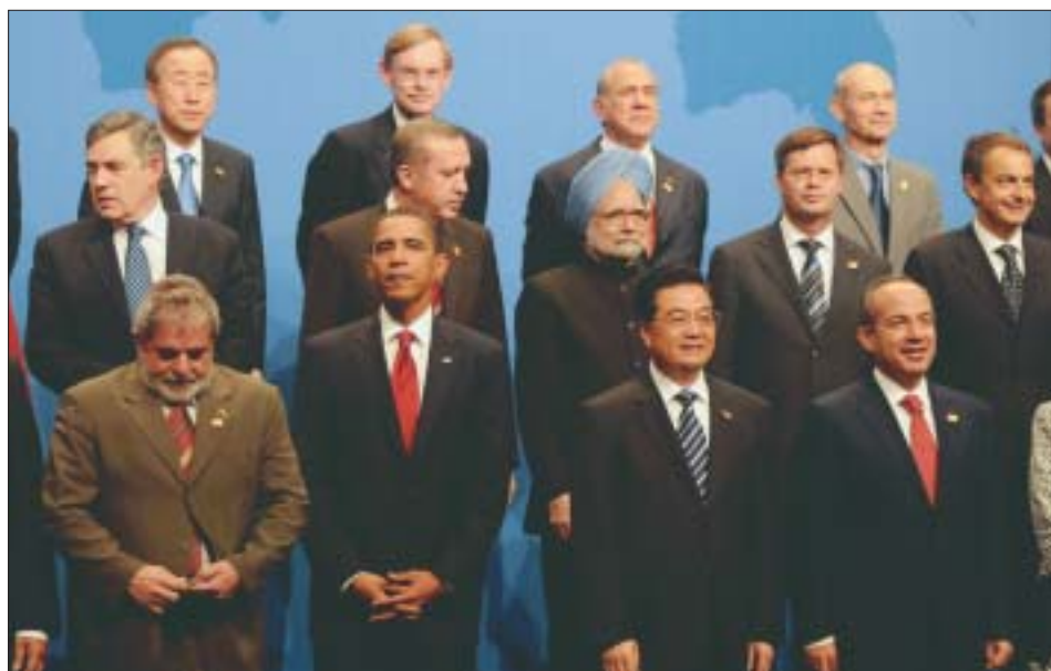
O Primeiro Ministro Dr. Manmohan Singh, em uma foto de grupo com os chefes de delegação na Cúpula do G-20, em Pittsburgh, 25 de setembro. O Presidente Lula da Silva também esteve presente.

"O Banco Mundial e outros bancos regionais de desenvolvimento podem desempenhar um papel importante através do financiamento de tais investimentos. Devem aumentar os empréstimos para o