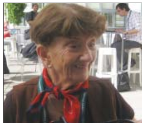
Suzana Amaral, cineasta brasileira

Ela acrescentou que queria muito exibir seus filmes no Festival Internacional de