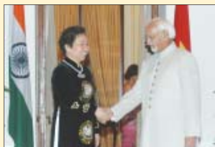
A Vice Presidente do Vietnã, Nguyen Thi Doan, recebida pelo Vice Presidente Mohd Hamid Ansari, em Nova Delhi, 1º de outubro.

Para ler a história completa, acesse: http://news.bbc.co.uk/2/hi/south_asia/8256410.stm