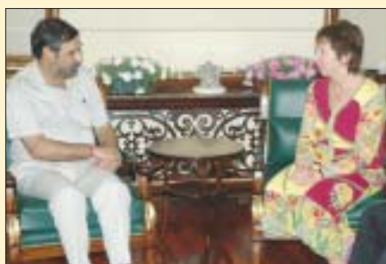
O Ministro indiano de Comércio e Indústria, Anand Sharma, com Catherine Ashton, Comissária responsável do Comércio da União Européia, em Delhi, 5 de setembro.