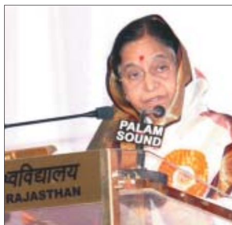
A Presidente Smt. Pratibha Devisingh Patil discursando na 25ª cerimônia do conselho da Universidade do Rajastão, em Jaipur, no dia 5 de março

O processo de globalização, juntamente com os rápidos avanços em ciência e tecnologia, principalmente em tecnologia da informação, tem definido as realizações, premências e atrativos destas últimas por mais de duas décadas. A globalização criou um mundo inter-relacionado e interligado, gerando oportunidades e também criando desafios. Suas características são as sociedades baseadas no conhecimento e no fluxo de bens e idéias, através das fronteiras nacionais. Atualmente, o foco é na crise