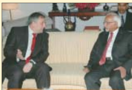
O Vice-Primeiro Ministro e Ministro das Relações Exteriores da Bulgária, Ivalo Kalfin, recebido pelo Vice-Presidente Mohd Hamid Ansari, Nova Delhi, 3 de março

Para a história completa acesse http://www.nytimes.com/2009/03/02/business/worldbusiness/02rupee.html?_r=1&scp=3&sq=India&st=cse