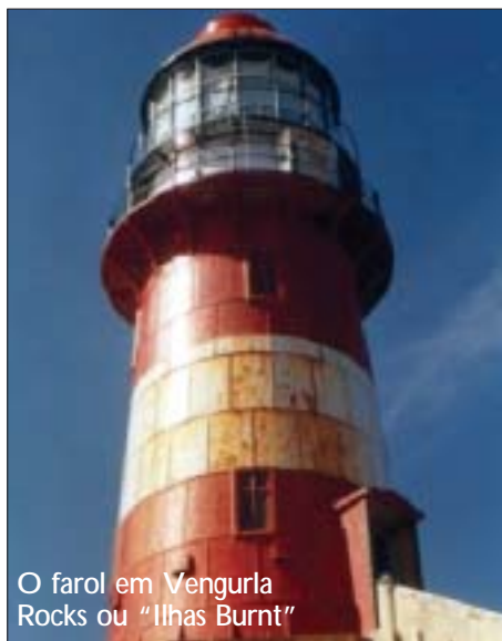
O farol em Vengurla Rocks ou “Ilhas Burnt”

Declaração de Exoneração de Responsabilidade: Notícias da Índia reúne conteúdos de fontes diversas e as visões expressas em entrevistas e artigos publicados não representam necessariamente as visões da Embaixada ou do Governo da Índia.