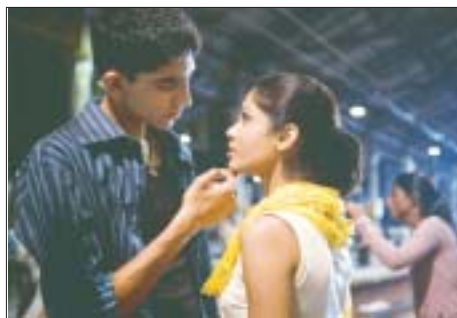
Em caminho das Índias, costumes milenares tratados de forma ficcional. Quem quer ser um milionário? Mostra contrastes de um país complexo

A Índia e o Brasil são parecidos em muitos aspectos e, ainda assim, tão diferentes. Ambos somos grandes países — sendo que o Brasil é mais de duas vezes o tamanho da Índia — com populações fervilhantes, sendo a da Índia cinco vezes maior que a do Brasil; existem grandes disparidades na distribuição de renda entre pessoas e regiões; somos culturas absolutamente vibrantes e temos orgulho disso, além de sermos democracias politicamente maduras. Atualmente, estamos juntos em fóruns muito importantes como BRIC, IBAS, G-20 e centenas de outros. Outro ponto a nosso favor é que somos países com tremenda afeição um pelo outro, com laços de amizade tanto na esfera de nossas lideranças políticas, como também entre os