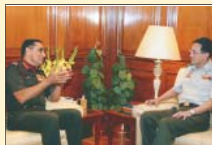
O Chefe das Forças de Defesa de Cingapura, Lt. Gen. Desmond Kuek com o Chefe do Estado-Maior do Exército indiano Deepak Kapoor, em Nova Delhi, 3 de março