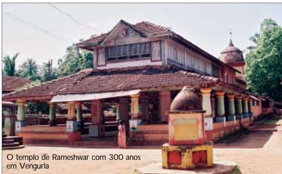
O templo de Rameshwar com 300 anos em Vengurla

Via terrestre: Serviços regulares de ônibus para Vengurla são disponíveis a partir de muitas cidades no estado de Maharashtra. Ônibus públicos e privadas circulam entre Vengurla e muitas cidades no país.