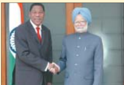
O Presidente do Benin, Dr. Boni Yayi, recebido pelo Primeiro Ministro Dr. Manmohan Singh, em Nova Delhi, 4 de março. Dr. Boni efetuou uma visita de cinco dias na Índia