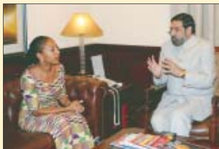
Samia Nkrumah, Membro do Parlamento de Gana, reuniu-se recentemente com o Ministro de Estado para Assuntos Exteriores, Anand Sharma, em Nova Delhi