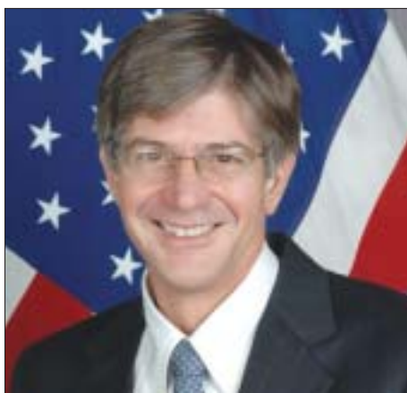
James Steinberg, Vice Secretário de Estado dos EUA

Ao pronunciar o discurso principal no Simpósio National Defense University 2009 sobre “O Papel da Segurança da América num Mundo Desafiador”, Steinberg disse que a emergência desses países como os principais operadores mundiais, foi resultado de um crescimento econômico generalizado e sem precedentes no mundo em desenvolvimento, bem como