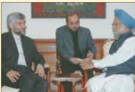
Vice-Primeiro Ministro e Ministro das Relações Exteriores da Bulgária, Ivalo Kalfin, recebidos recentemente pelo Primeiro Ministro Dr. Manmohan Singh, em Nova Delhi

Para ler a história completa, acesse http://online.wsj.com/article/SB123809625112550781.html