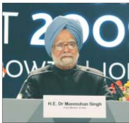
Primeiro Ministro Dr. Manmohan Singh dirigindo-se à imprensa no final da Cúpula do G-20 em Londres, 2 de abril

O objetivo desta Cúpula foi de levar adiante a busca de soluções para a crise econômica enfrentada atualmente pela economia global. O mundo está atravessando a pior recessão desde a Grande