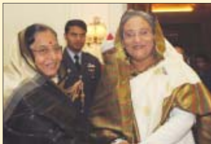
A Primeira Ministra de Bangladesh, Sheikh Hasina, recebida pela Presidente, Smt. Pratibha Devisingh Patil, em Nova Delhi, 11 de janeiro.

Para ler a história completa, acesse: http://online.wsj.com/article/SB126285198055719327.html