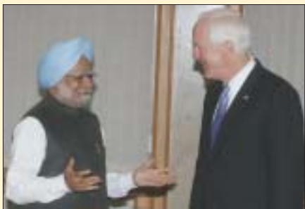
O Senador norte-americano, Judd Gregg, chefe de uma delegação dos EUA à Índia, recebido pelo Primeiro Ministro Dr. Manmohan Singh, em Nova Delhi, 4 de janeiro.