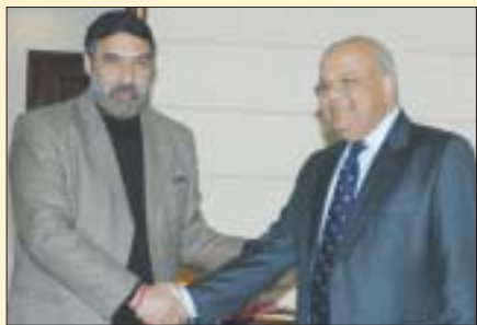
O Ministro das Finanças da África do Sul Pravin Gordhan com o Ministro do Comércio e Indústria Anand Sharma, em Nova Delhi, 7 de janeiro.