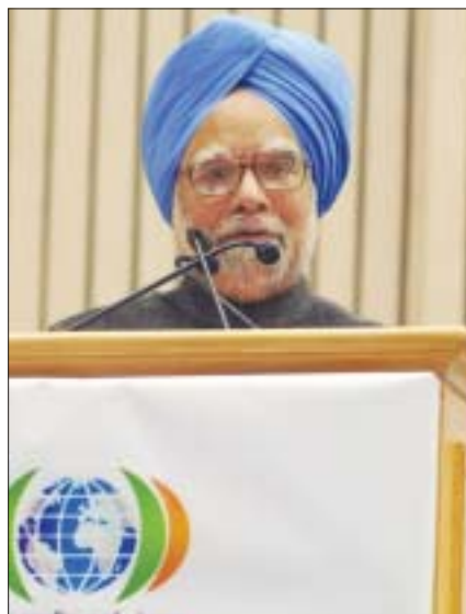
Primeiro Ministro Dr. Manmohan Singh no discurso inaugural da 8ª Pravasi Bharatiya Divas (PBD) -2010, em Nova Delhi, 8 de janeiro.

Mas subjacente a nosso sistema, há uma inerente resiliência política e econômica que dá ao país e às instituições uma grande força e dinamismo. Desde o ano passado, o mundo tem enfrentado uma crise