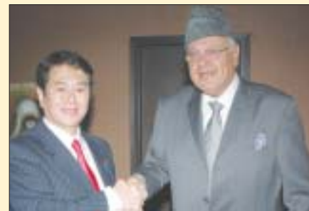
O Ministro japonês do Interior Kazuhiro Haraguchi com o Ministro das Novas Energias Renováveis Dr. Farooq Abdullah, em Nova Delhi, 6 de janeiro.