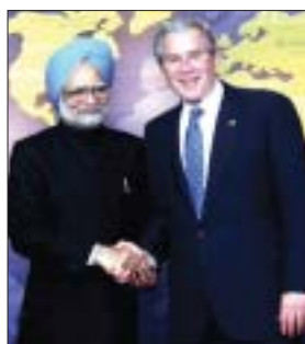
PM Dr. Manmohan Singh com o Presidente George W. Bush na Casa Branca, 14 de novembro.

Bloqueou os canais normais de crédito, provocando um colapso mundial nas bolsas de valores em todo o mundo. A economia real está claramente afetada. Os países industrializados devem diminuir suas atividades em 2008. Devem agora sofrer uma recessão no segundo semestre deste ano, e até agora há poucas perspectivas de uma pronta recuperação. Muitos consideram-na como a mais séria crise desde a Grande Depressão. Os países de mercados emergentes não foram a causa desta crise, mas estão