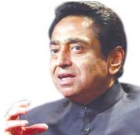
Índia permanecerá um destino IDE muito atrativo: Kamal Nath