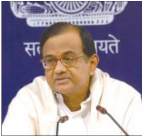
O Ministro de Finanças da União P. Chidambaram discursando na abertura da Conferência Anual dos Editores Econômicos, organizada pelo Press Information Bureau, em Nova Delhi, 24 de novembro

Os setores de manufaturados, comunicações, comércio, agricultura e construção que foram os maiores motores de crescimento da economia indiana no passado, devem apresentar uma desaceleração do crescimento, disse ele.