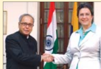
A Ministra das Relações Exteriores do Equador Maria Isabel Salvador com o Ministro das Relações Exteriores Pranab Mukherjee, em Nova Delhi, 17 de novembro