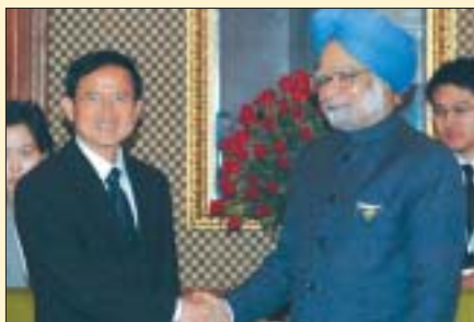
O Primeiro Ministro da Tailândia, Somchai Wangawat, com o Primeiro Ministro Dr. Manmohan Singh, em Nova Delhi, 13 de novembro