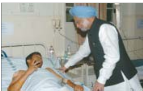
O Primeiro Ministro consola um ferido no ataque terrorista em Mumbai.

Não podemos tolerar uma situação em que a segurança de nossos cidadãos possa ser violada impunemente por terroristas. Tomaremos as mais fortes medidas possíveis para assegurar que tais atos terroristas não se repetirão. Estamos determinados a fazer todo o