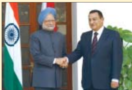
O Primeiro Ministro Dr. Manmohan Singh recebendo o Presidente da República Árabe do Egito Mohamed Hosny Mubarak, em Nova Delhi, 18 de novembro

Para ler a história completa, acesse: http://www.ft.com/cms/s/0/55748f52-b2b3-11dd-bbc9-0000779fd18c.html?nclick_check=1