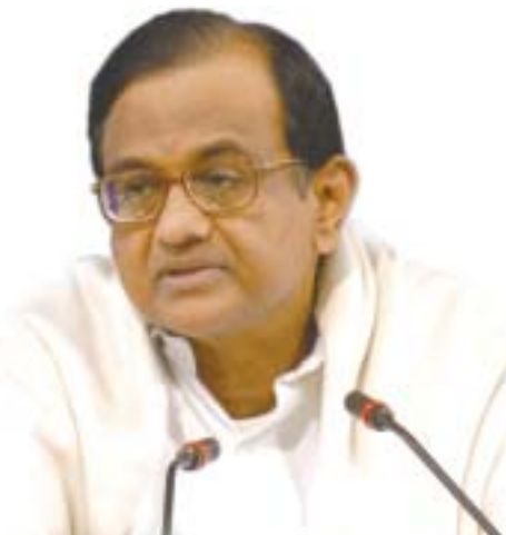
Índia: 2ª maior economia acelerada