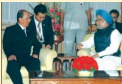
O Primeiro Ministro de Mianmar, General Thein Sein, com o Primeiro Ministro Dr. Manmohan Singh, em Nova Delhi, 12 de novembro