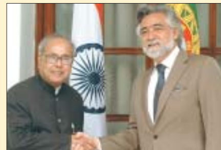
O Ministro das Relações Exteriores de Portugal, Dr. Luis Amado, com o Primeiro Ministro Dr. Manmohan Singh em Nova Delhi, 7 de julho.