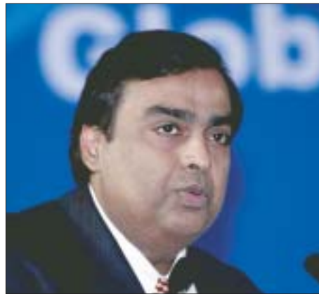
Mukesh Ambani, maior bilionário indiano

A riqueza combinada dos 10 milhões de milionários cresceu cerca de US$ 41 tri-