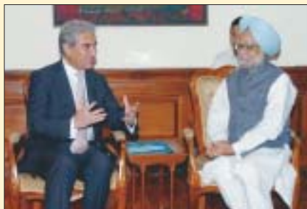
O Ministro das Relações Exteriores do Paquistão, Shah Mahmood Qureshi, recebido pelo Primeiro Ministro Dr. Manmohan Singh, em Nova Delhi, 27 de junho.