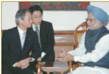
O porta-voz da Câmara alta do Parlamento japonês, Satsuki Eda, recebido pelo Primeiro Ministro Dr. Manmohan Singh em Nova Delhi, 2 de julho.