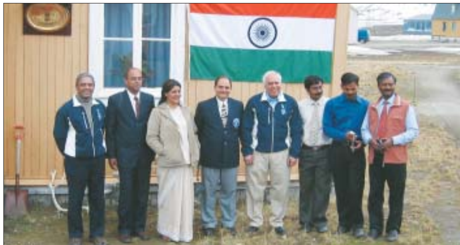
O Ministro da União da Ciência e Tecnologia e Ciências da Terra Kapil Sibal, juntamente com a equipe de cientistas indianos após a inauguração de "Himadri", o novo centro indiano de pesquisa no Ártico

Ministro Sibal expressou contentamento pelo fato que o Programa Ártico Indiano, iniciado em agosto de 2007, com um pequeno contingente de cinco cientistas, tenha se expandido e se tornado uma verdadeira estação de pesquisa em menos de