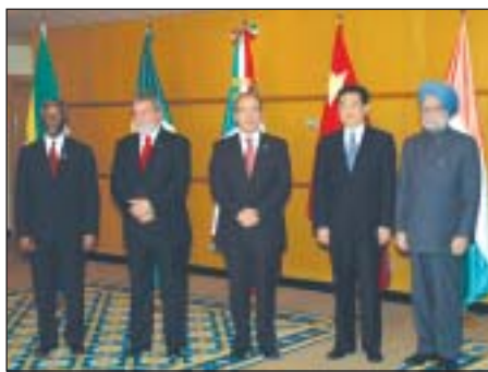
Da esquerda: Presidente da África do Sul Thabo Mbeki, Presidente do Brasil Lula Da Silva, Presidente do México Felipe Calderon Hinojosa, Presidente da China Hu Jintao e o Primeiro Ministro da Índia Manmohan Singh, na recente Cúpula do G-8, em Sapporo, no Japão.

Os 5 membros do grupo ampliado da Cúpula do G-8 também lideraram uma aliança chave dos países em desenvolvimento na rodada de Doha da OMC contra os subsídios pesados prestados aos ricos agricultores dos países industrializados. Disseram que a comunidade internacional reconheceu que a realização das metas de desenvolvimento internacionalmente aceitas, incluindo aquelas