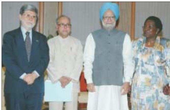
O Primeiro Ministro Manmohan Singh com o Ministro Celso Amorim e a Ministra das Relações Exteriores da África do Sul, Nkosazana Dlamini Zuma, em Nova Delhi. O Ministro indiano das Relações Exteriores Pranab Mukherjee também está presente.

Os Ministros das Relações Exteriores da Índia, Brasil e África do Sul encontraram-se na Quarta Comissão Mista do Foro de Diálogo Trilateral da IBAS, 17 de julho para intensificar a cooperação entre os três países, antes da segunda reunião a ser realizada no decorrer do ano, em Johannesburg. A busca da Índia pela cooperação nuclear civil mundial foi estimulada no dia 17 de julho com o interesse do Brasil e da África do Sul em apoiar Nova Delhi no Grupo de Supridores Nucleares (NSG). “Temos cooperação com o Brasil e a África do Sul no NSG. A menos que o acordo nuclear civil 123 (com os EUA) seja finalizado o NSG não pode formular sua posição. Um tem que seguir o outro,” declarou aos repórteres Pranab Mukherjee, Ministro indiano das Relações Exteriores, durante uma reunião conjunta de imprensa realizada com seus homólogos, Celso Amorim e Nkosazana Dlamini-Zuma da África do Sul. Ambos o Brasil e a África do Sul são importantes membros do NSG. “Os ministros concordaram em explorar abordagens de cooperação em usos pacíficos de energia nuclear, sob a salvaguarda apropriada da AIEA (Agência Internacional de Energia Atômica),” disse um Comunicado Conjunto dos Ministros das Relações Exteriores da Índia, Brasil e África do Sul, publicado após a comissão