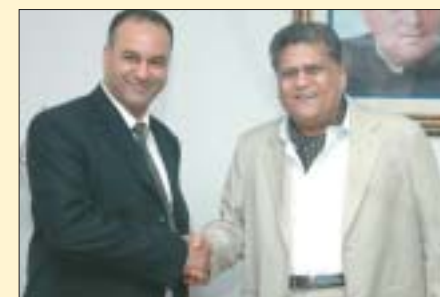
O Ministro líbio das Finanças, Ali Abdullah Al-Essawi, com o Ministro da União para as Indústrias Pesadas, Sontosh Mohan Dev, em Nova Delhi, 12 de julho.