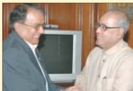
O Ministro nepalês para a Paz e a Reconstrução, Ram Chander Poudel, com o Ministro das Relações Exteriores, Pranab Mukherjee, em Nova Delhi, 10 de julho.