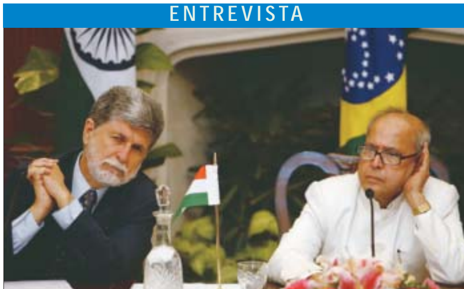
O Ministro das Relações Exteriores, Pranab Mukherjee com seu homólogo brasileiro Celso Amorim, durante uma entrevista coletiva em Nova Delhi, 17 de julho.

Meu sonho é que países como Índia, Brasil, e África do Sul — incluindo o Mercosul e a SACU (União Aduaneira da África Austral) — possam formar um grande espaço econômico. Claro que levará tempo, mas isso nos permitirá uma melhor posição para enfrentar o Norte de modo criativo e competitivo.