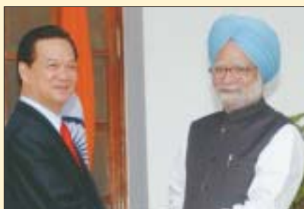
O Primeiro Ministro vietnamita, Nguyen Tan Dung, com o PM Manmohan Singh, em Delhi, 6 de julho. Dung visitou a Índia na primeira semana de julho.

Para ler a história completa, acesse: http://www.ft.com/cms/s/c6caf904-2f4a-11dc-b9b7-0000779fd2ac.html