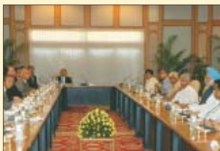
Delegação Empresarial japonesa conduzida pelo Ministro das Finanças, Akira Amari, com o Primeiro Ministro Manmohan Singh, numa reunião em Nova Delhi, 2 de julho.