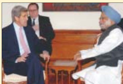
O Senador democrata norte-americano, John Kerry, recebido pelo Primeiro Ministro, Dr. Manmohan Singh, em Nova Delhi, 15 de dezembro