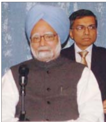
O Primeiro Ministro Dr. Manmohan Singh discursando na conferência dos Chefes de Missão, em Nova Delhi, 23 dezembro

Discursando no encontro, em 23 de dezembro, o Primeiro Ministro Dr. Manmohan Singh salientou que a política exterior da Índia deveria ampliar, de maneira lúcida, os interesses nacionais. Os maiores desafios enfrentados pelo país são a eliminação da pobreza, doença e ignorância, declarou o Primeiro Ministro. A eliminação da pobreza e a emancipação de nosso povo deve ser o orgulho da política exterior da Índia. Os esforços diplomáticos indianos devem ser orientados para eliminar os obstáculos que impedem de alcançar estes objetivos. É preciso uma atenção especial para garantir a segurança alimentar, a gestão dos recursos hídricos, a segurança energética e a superação dos regimes de recusa tecnológica, acrescentou Dr. Singh. O Primeiro Ministro observou que a globalização deve permanecer e que a interdependência entre as nações se tornou um fato. Isso resulta em uma interligação cada vez mais forte dos destinos das nações. A Índia é um país que não é bem dotado em recursos naturais per capita e, por esta razão, tem que se tornar uma grande nação