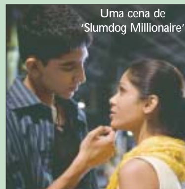
Uma cena de 'Slumdog Millionaire'

Melhor Filme oferecido pelos Críticos de Cinema de Boston, além de ganhar o prêmio Melhor Edição. Considerado um dos 10 melhores filmes de 2008 pelo roteirista David Germain da Associated Press, classificado em quarta posição, 'Slumdog Millionaire' também ganhou quatro prêmios EDA (Ativismo Dinâmico de Excelência) da Aliança de Mulheres Jornalistas de Cinema (AWFJ), incluindo Melhor Filme e Melhor Direção.