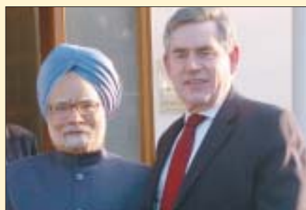
O Primeiro Ministro britânico, Gordon Brown, recebido pelo Primeiro Ministro, Dr. Manmohan Singh, em Nova Delhi, 14 de dezembro