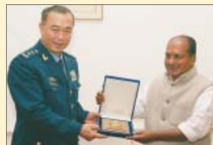
Vice-Chefe do Comando Geral do Exército Popular de Libertação da China, Lt. Gen Ma Xiaotian com o Ministro da Defesa A.K. Antony, em Nova Delhi, 10 de dezembro