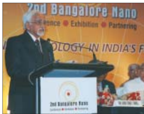
O Vice Presidente indiano Mohd. Hamid Ansari discursando na inauguração de Bangalore Nano-2008, 13 de dezembro

"Bangalore Nano trouxe empresários emergentes, profissionais da indústria e capitalistas de risco para uma plataforma comum, visando facilitar a criação de redes e interações empresariais. Precisamos mais plataformas como estas no país para diversos setores da indústria e pesquisa," disse