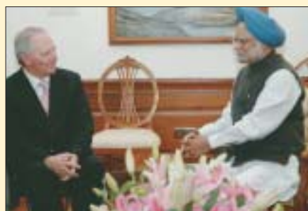
O Ministro alemão do Interior, Dr. Wolfgang Schaeuble, recebido pelo Primeiro Ministro Dr. Manmohan Singh, em Nova Delhi, 12 de dezembro