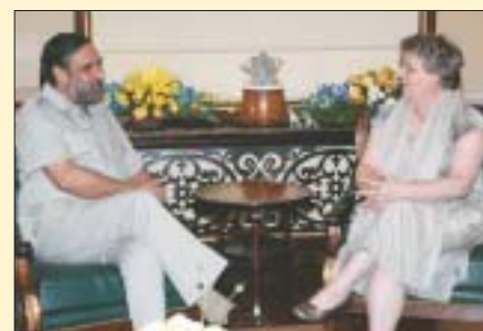
A Ministra sul-africana para as Empresas Públicas, Barbara Hogan, com o Ministro do Comércio e Indústria, Anand Sharma, em Nova Delhi, 1º de junho.