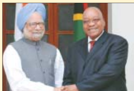
O Primeiro Ministro Dr. Manmohan Singh reuniu-se com o Presidente da África do Sul, Dr. Jacob Zuma em Nova Delhi, 4 de junho.