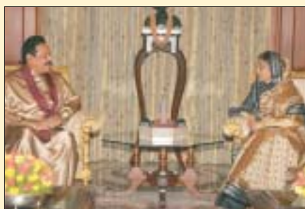
O Presidente do Sri Lanka, Mahinda Rajapaksa, recebido pela Presidente Smt. Pratibha Devisingh Patil, em Nova Delhi, 9 de junho.