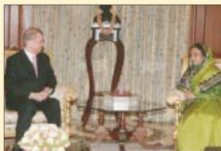
O Presidente das Ilhas Seychelles, James Alix Michel, recebido pela Presidente Smt. Pratibha Devisingh Patil, em Nova Delhi, 2 de junho.

Para ler a história completa, acesse: http://dealbook.blogs.nytimes.com/2010/06/06/reliance-of-india-looks-to-sell-a-26-stake/?scp=3&sq=India&st=cse