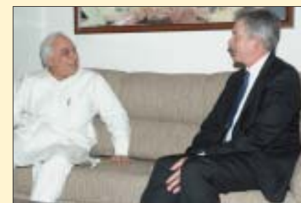
O Subsecretário dos EUA para Assuntos Políticos, William J. Burns, com o Ministro de Desenvolvimento de Recursos Humanos, Kapil Sibal, em Nova Delhi, 15 de outubro.