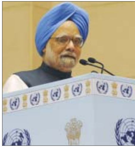
Primeiro Ministro Dr. Manmohan Singh no discurso inaugural da Conferência de Delhi sobre Mudança do Clima, em Nova Delhi, em 22 de outubro.

Elas têm de ser apoiadas pelo estabelecimento de acordos financeiros adequados para facilitar a transferência de tecnologia. Os países industrializados têm a capacidade de mudança nos processos de maior eficiência energética, mesmo se isto implica em custos adicionais. Os países em desenvolvimento não têm essa capacidade e, portanto, é necessário que a mudança, neste caso, seja facilitada pelo apoio financeiro adequado. Esperamos que no momento em que a nova tecnologia for ampliada, haverá uma redução de custos, tornando-a mais acessível. Inicialmente, a transição nos países em desenvolvimento necessitará um apoio financeiro crítico. A Convenção-Quadro da ONU sobre Mudança do Clima deve desempenhar um papel importante no