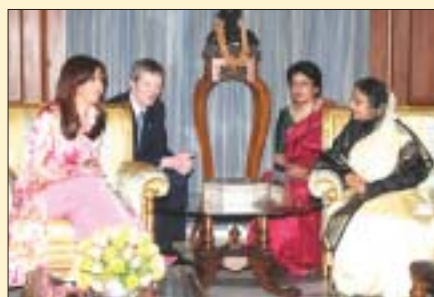
A Presidente da Argentina, Cristina Fernández Krichner recebida pela Presidente, Smt. Pratibha Devisingh Patil, em Nova Delhi, 14 de outubro.