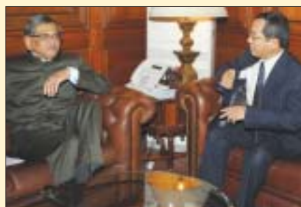
O Ministro das Relações Exteriores S.M. Krishna com o Vice-Ministro vietnamita dos Relações Exteriores Viet Dao Tnung em Nova Delhi, 16 de outubro.