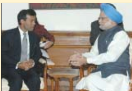
O Presidente das Maldivas, Mohamad Nasheed, recebido pelo Primeiro Ministro, Dr. Manmohan Singh, em Nova Delhi, 22 de outubro.